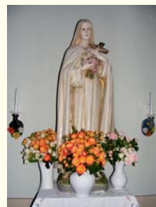
Lisieux-i Szent Teréz

„Nem vagyok tökéletes, de szent akarok lenni!”