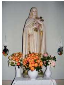
Lisieux-i Szent Teréz

„Nem vagyok tökéletes, de szent akarok lenni!”